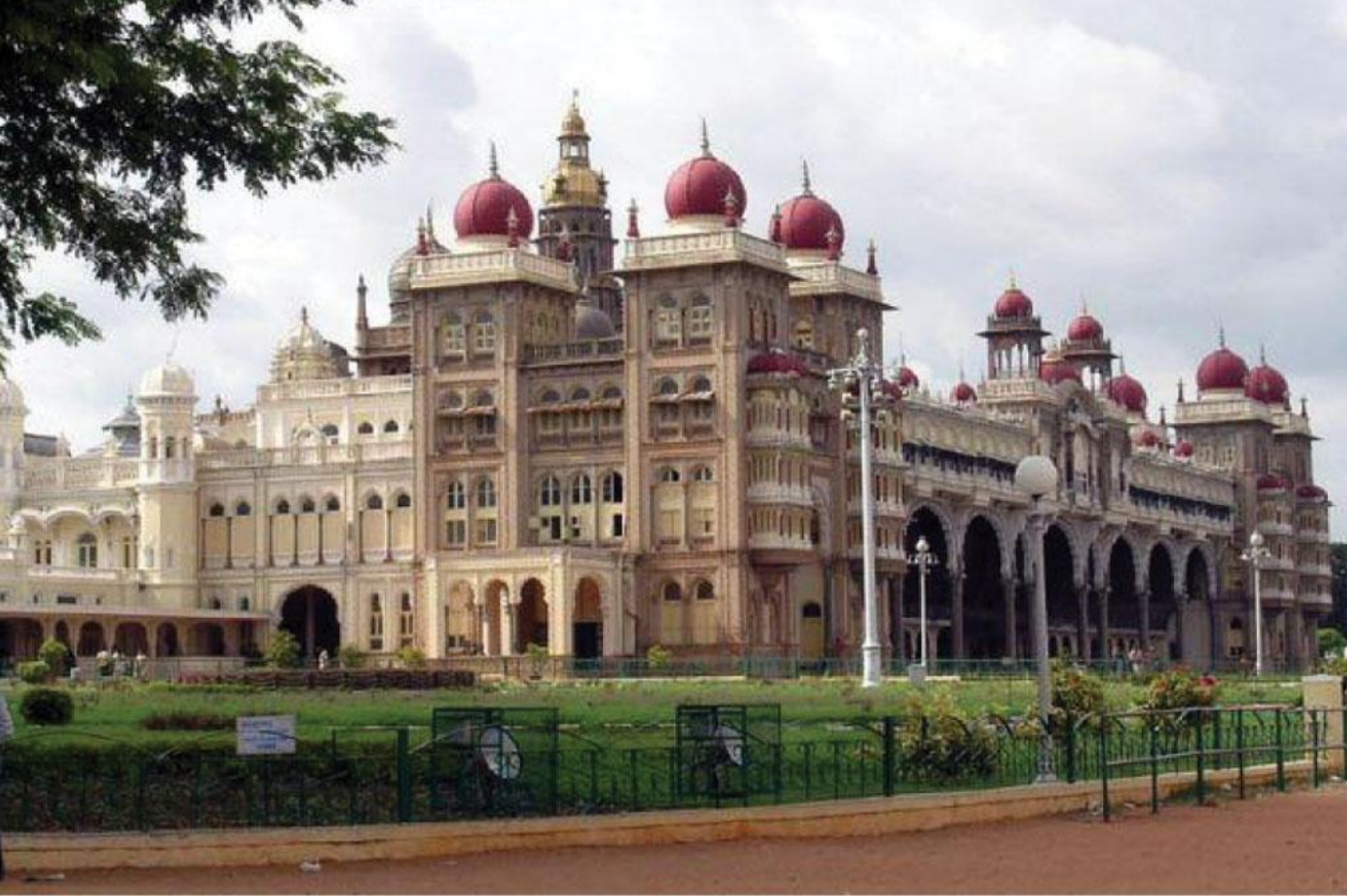
महैसूर पॅलेस - महैसूर, राज्य कर्नाटक