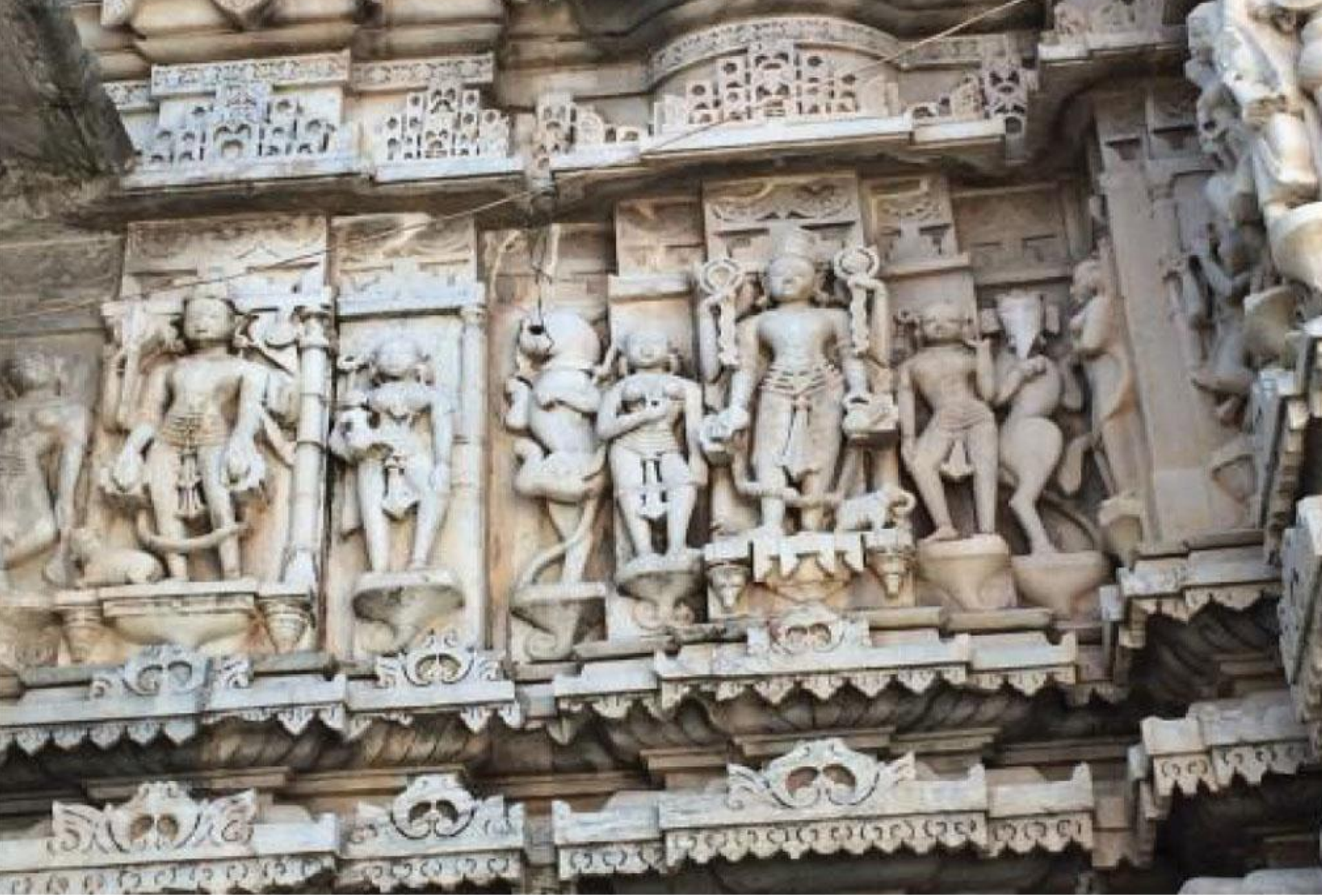
उडीपूरी, राज्य राजस्थान