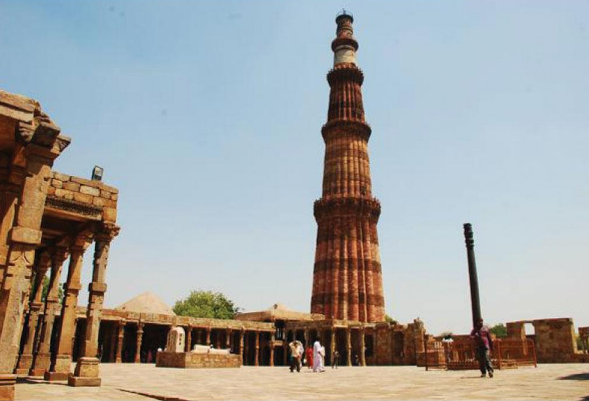
कुतुब मिनार - दिल्ली