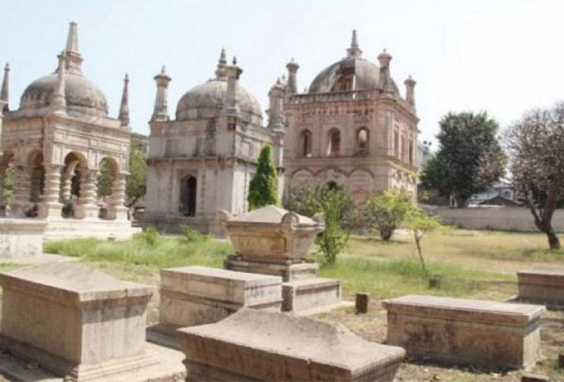
युरोपीयन थडगे - सुरत, राज्य गुजरात