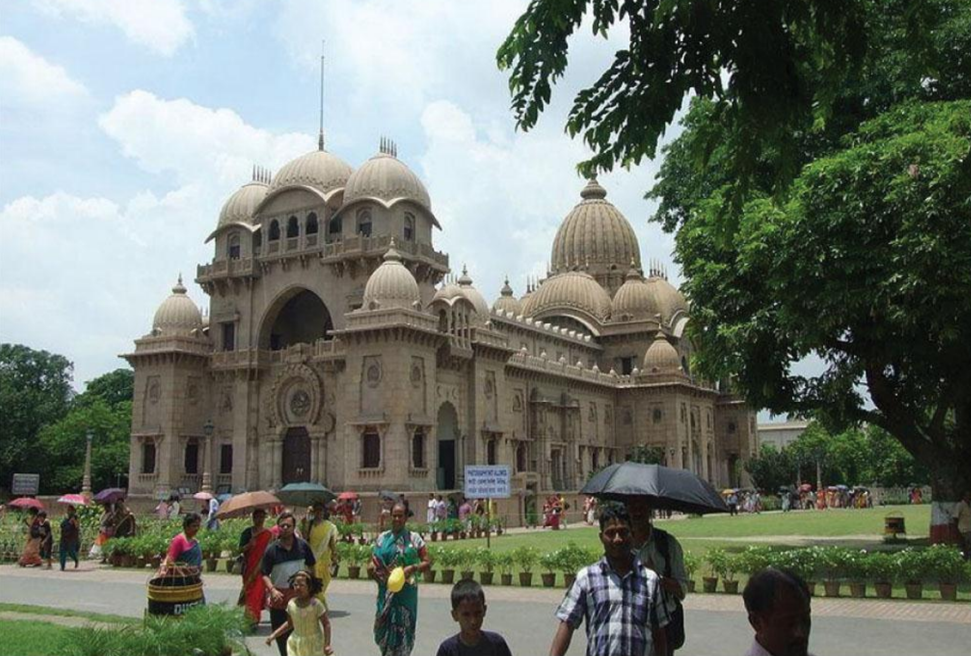
बेलूर मठ - कोलकता, पश्चिम बंगाल