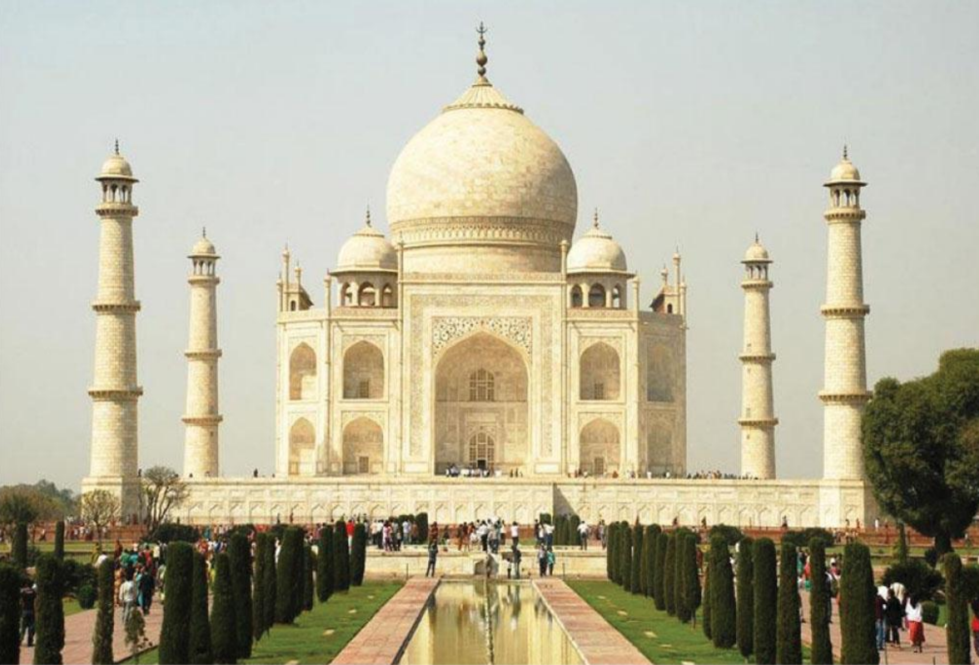
ताज महल - आग्रा, राज्य उत्तर प्रदेश