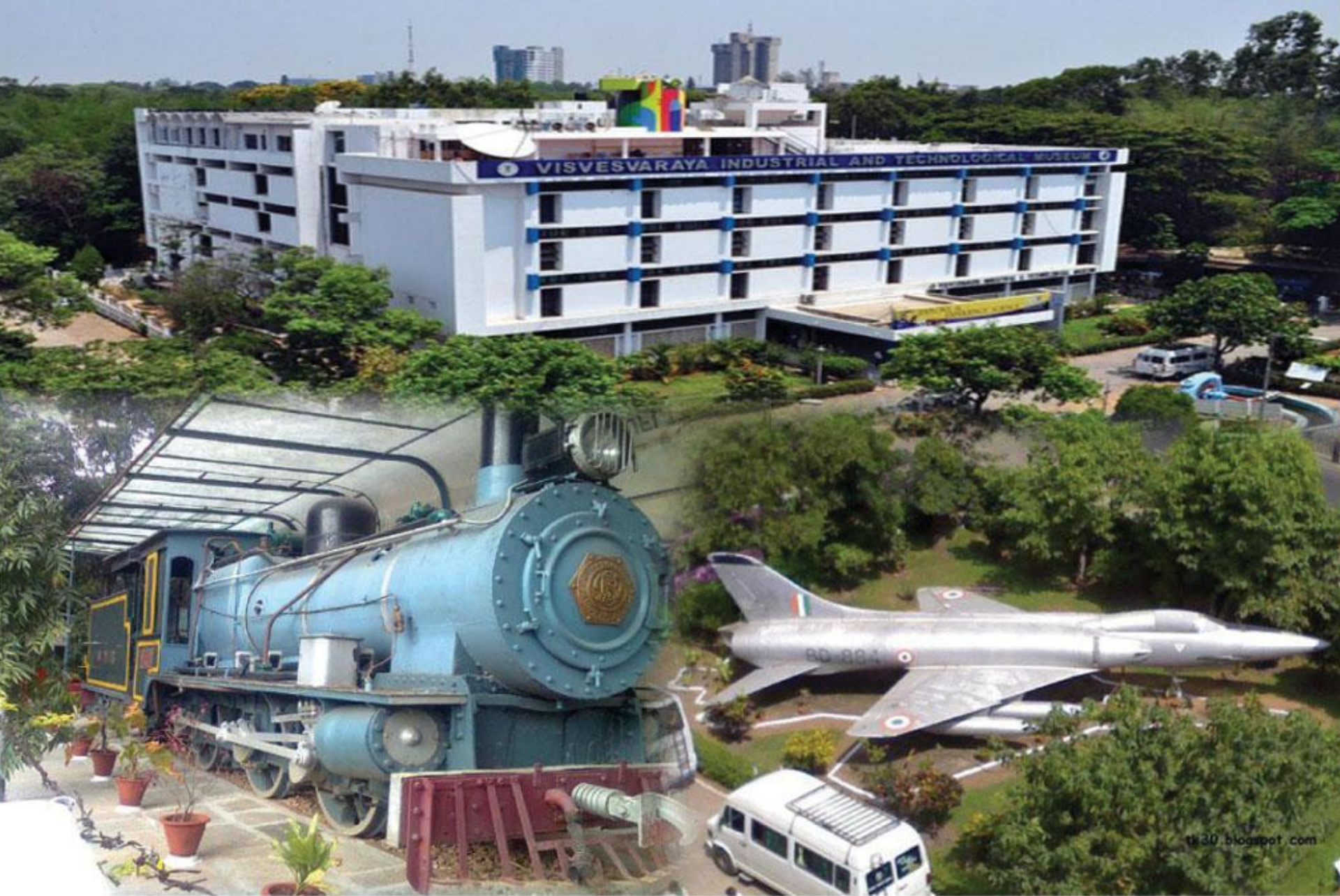
विश्वेश्वरया संग्रहालय - बेंगलोर, राज्य कर्नाटक