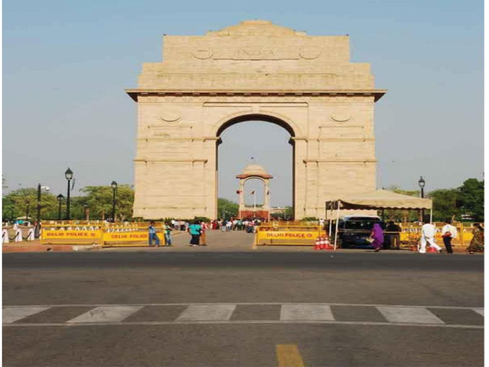
इंडिया गेट - दिल्ली