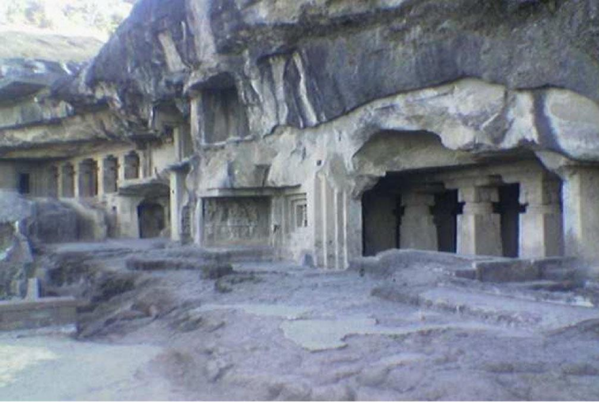
वेरुळ लेणी, औरंगाबाद, राज्य महाराष्ट्र