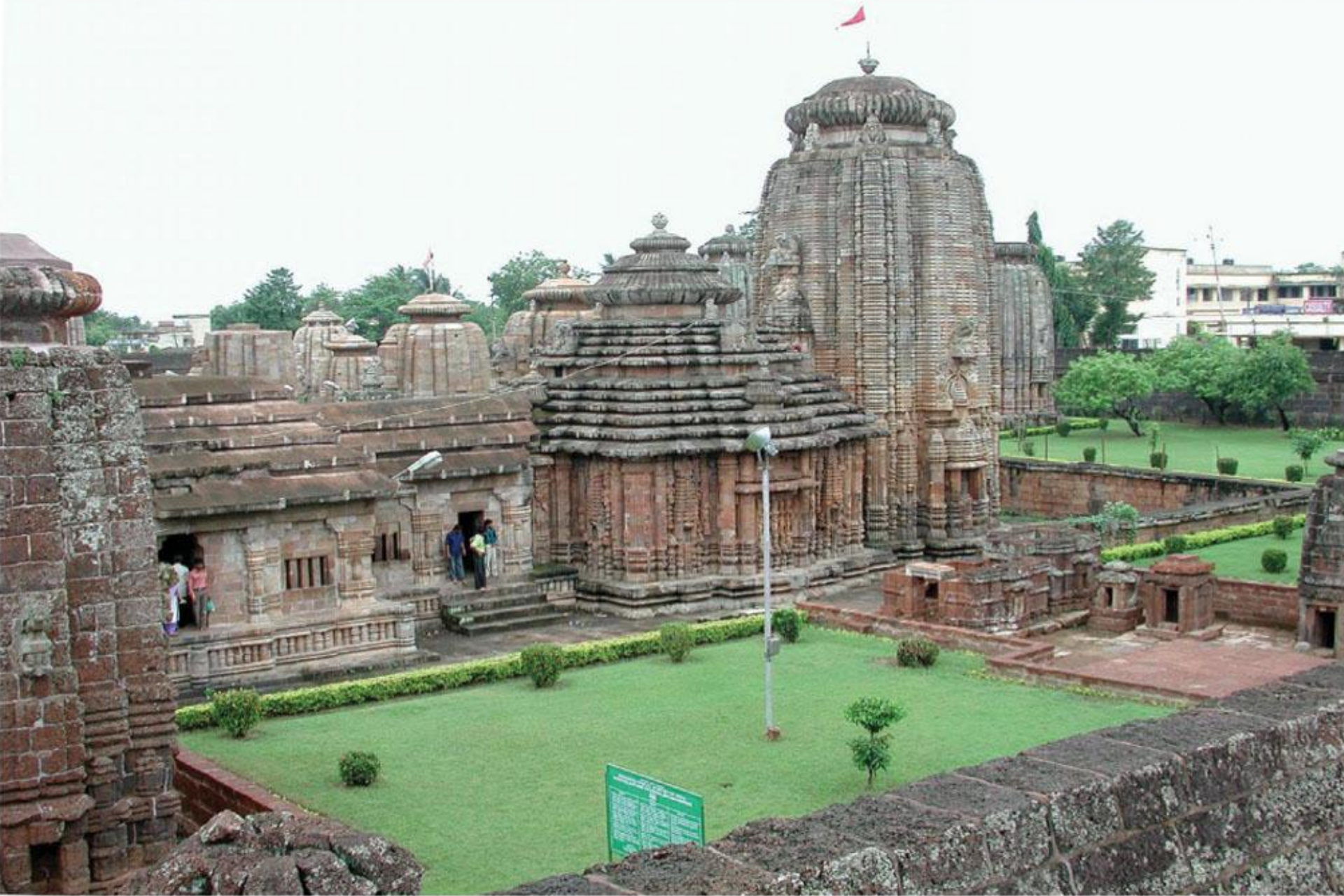
भुवनेश्वर, राज्य उडीसा