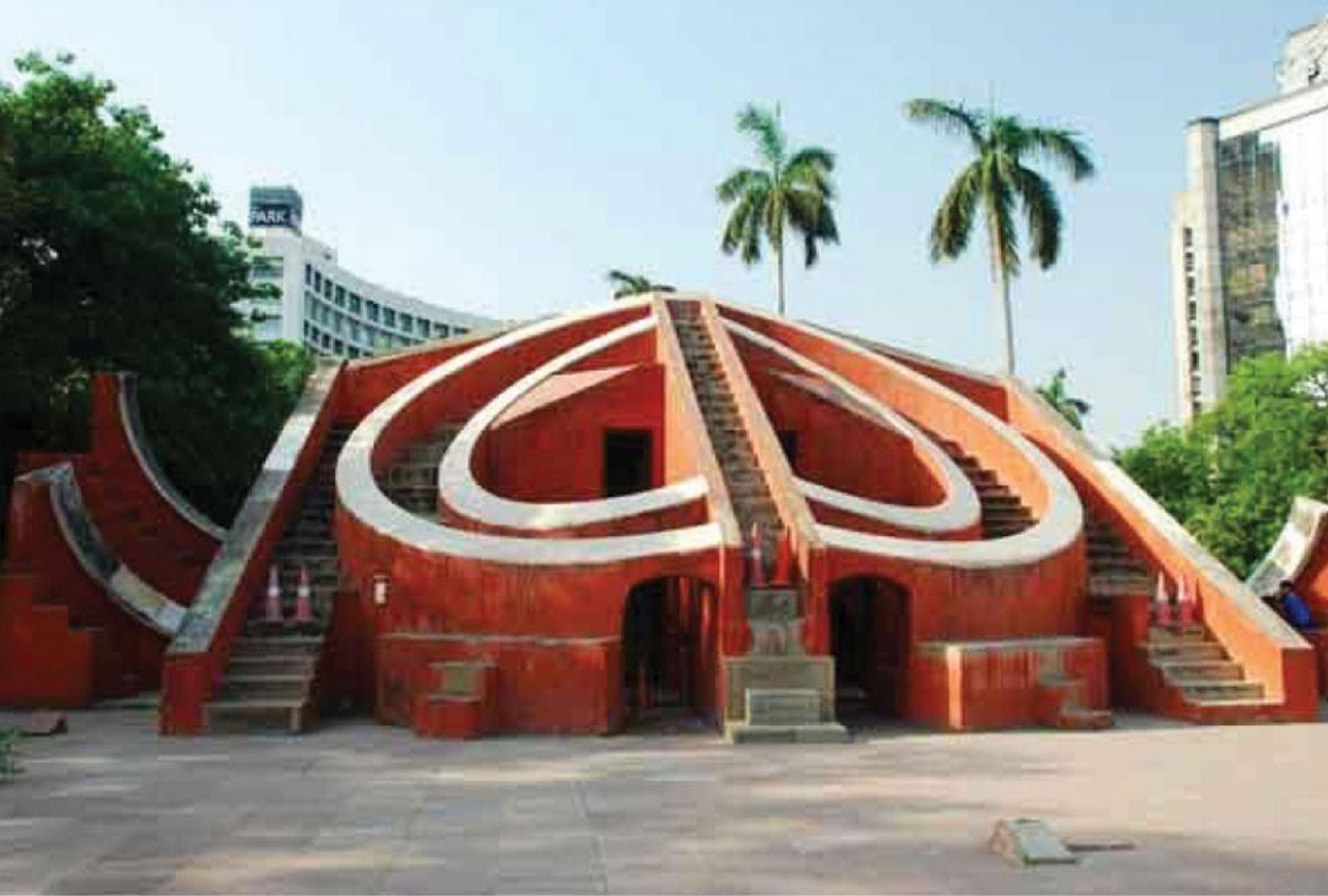
जंतर मंतर - दिल्ली