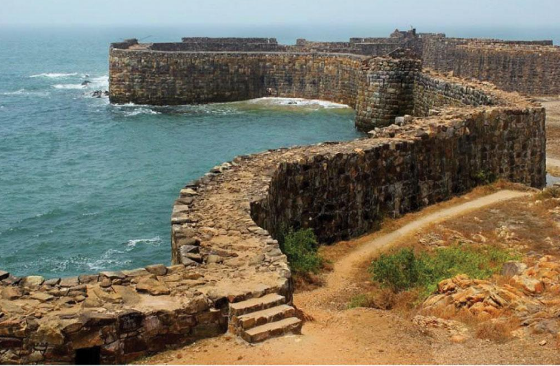
सिंधुदुर्ग किल्ला - सिंधुदुर्ग, राज्य महाराष्ट्र