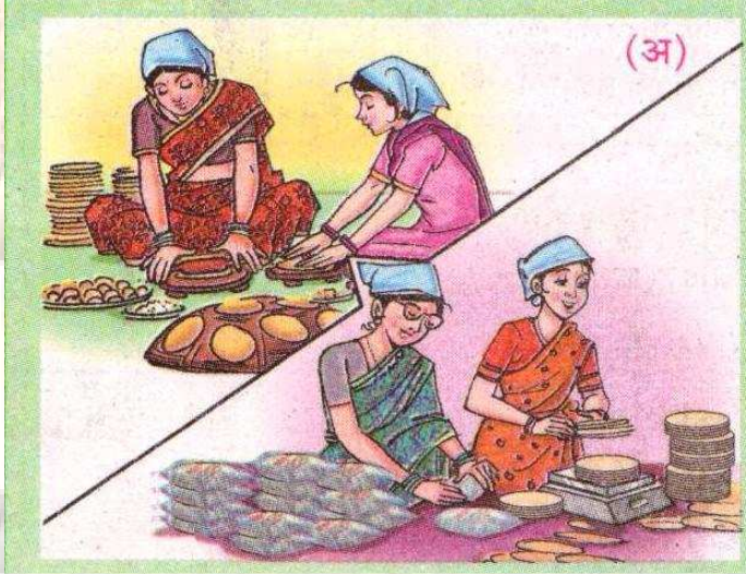
पापड बनविण्याचा उद्योग

खाली दिलेल्या चित्रांचे निरीक्षण करा व चित्रातील उद्योगाचे नाव सांगा