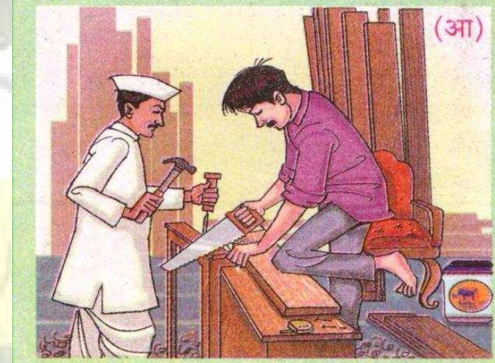
फर्निचर - सुतार काम करणारा